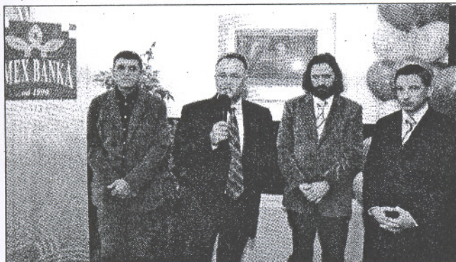
Detalj s otvorenja podružnice Imex banke u Varaždinu

Sve informacije o ponudi Imex banke mogu se dobiti na broju telefona varaždinske podružnice 332-820. I.Č.