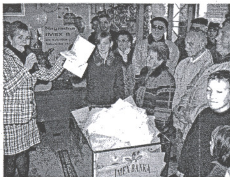
Izvištenje dobitnika odvijalo se pod budnim okom štediša