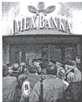
Gužva pred poslovnicom Imex banke